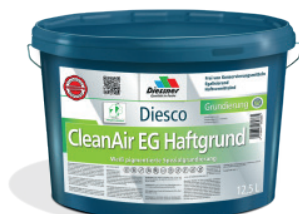
CleanAir EG Haftgrund