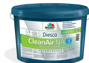
CleanAir NA 3