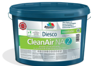
CleanAir NA 2