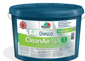
CleanAir NA 1