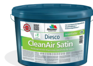
CleanAir Satin vægmaling