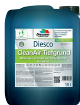
CleanAir Dybdegrunder W