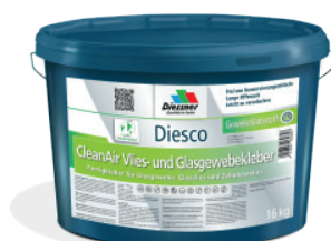
CleanAir Filt & vævklæber