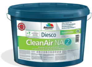
CleanAir NA 2