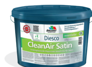
CleanAir Satin vægmaling