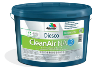
CleanAir NA 3