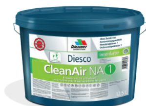
CleanAir NA 1