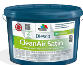
CleanAir Satin vægmaling