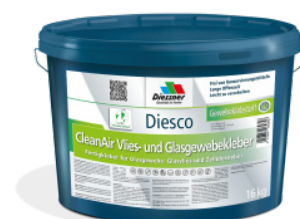
CleanAir Filt- og Vævklæber