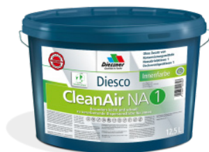
CleanAir NA 1