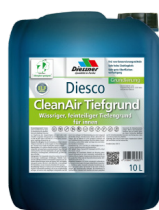
CleanAir Dybdegrunder W